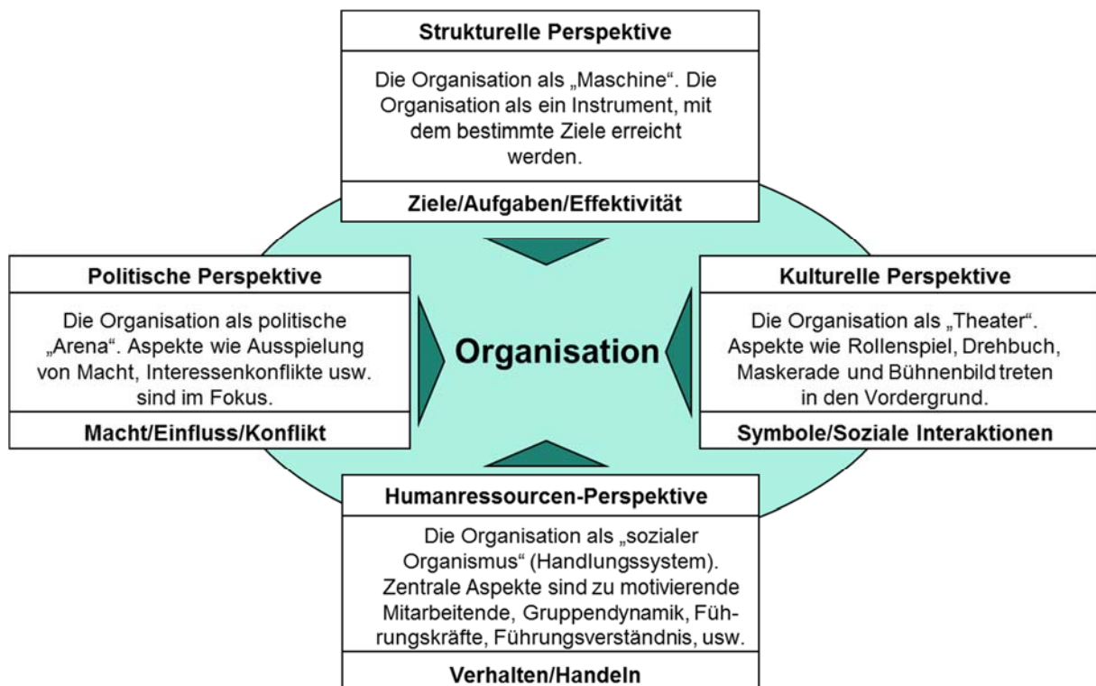
Abb. 2: Verschiedene Perspektiven auf Veränderungsprozesse, in Anlehnung an Bolman und Deal (2003).

Die folgende Abbildung zeigt die vier Perspektiven mit den zentralen Metaphern und der jeweiligen Aufmerksamkeitssteuerung im Überblick: